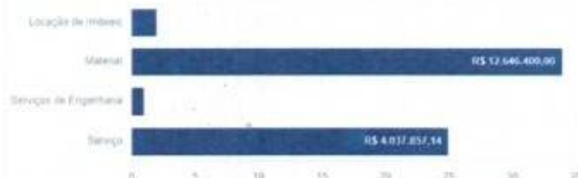
Valor Total Estimado e Qtde de itens por Categoria

Valor Total estimado (R$): R$ 18.404.257,14