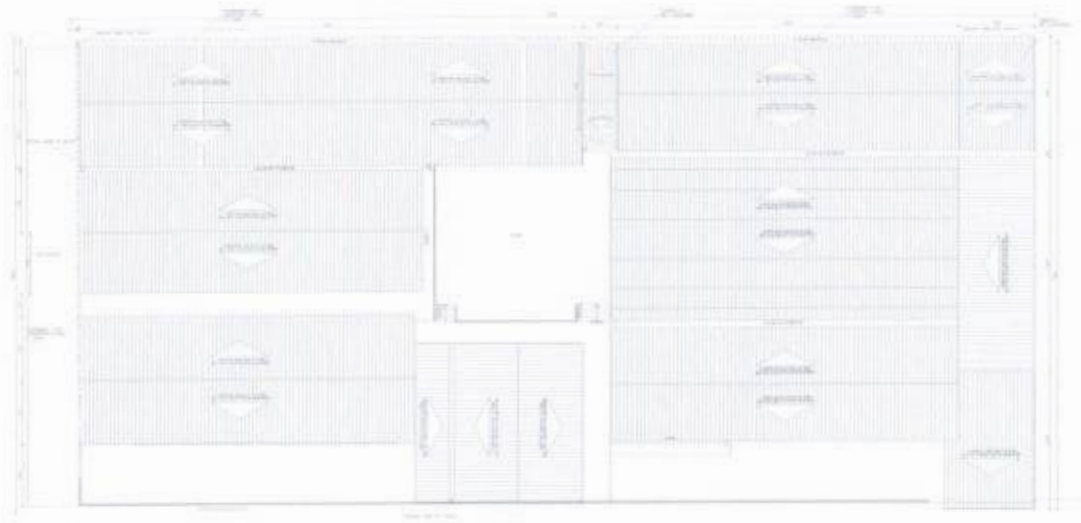
02 PLANTA DE COBERTA