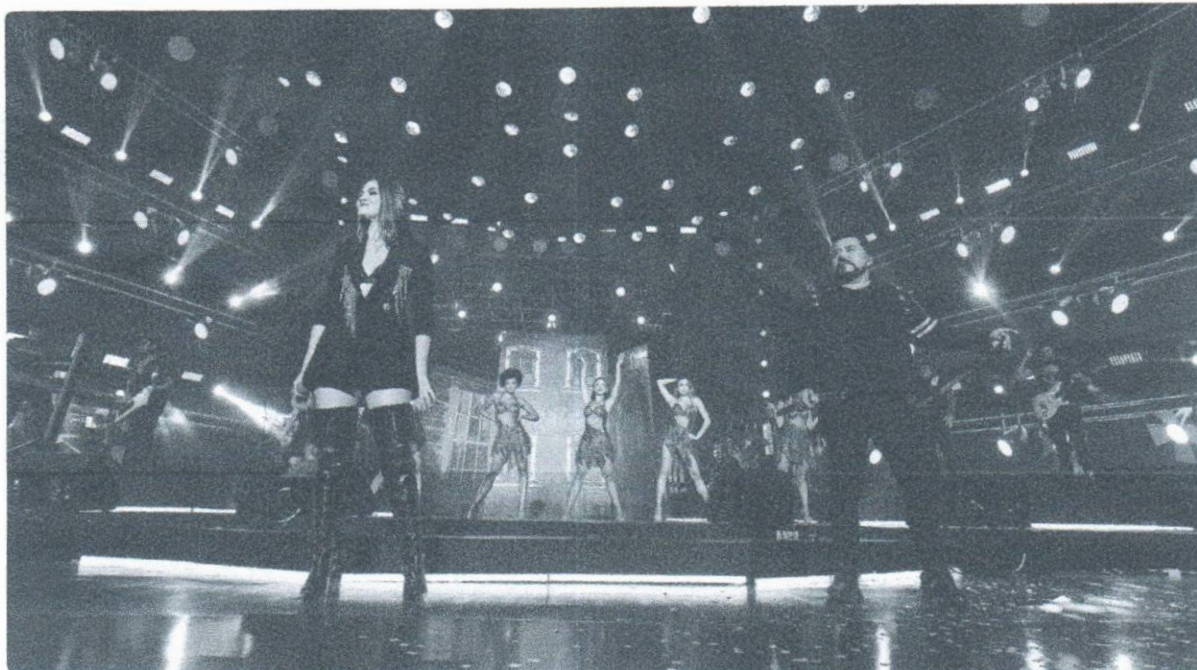
Banda Limão com Mel

Para além da "caixinha" do forró embalado pela autenticidade nordestina, leia-se: o sempre e necessário pé de serra, o teng-lengo-tengo sob arranjos de bandas como Mastruz com Leite , Calcinha Preta, Limão com Mel e Cavalo de Pau, integra o rol dos (bons) tempos de um dos ritmos carros-chefes das bandas de cá de Pernambuco .