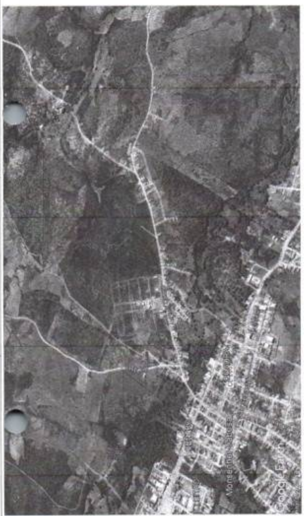
02 SETA PARA LOCALIDADE VOLTA DO RIO