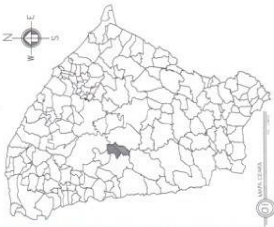
01 MAPA CEARÁ