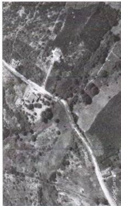
04 LOCALIZAÇÃO PASSAGEM MOLHADA