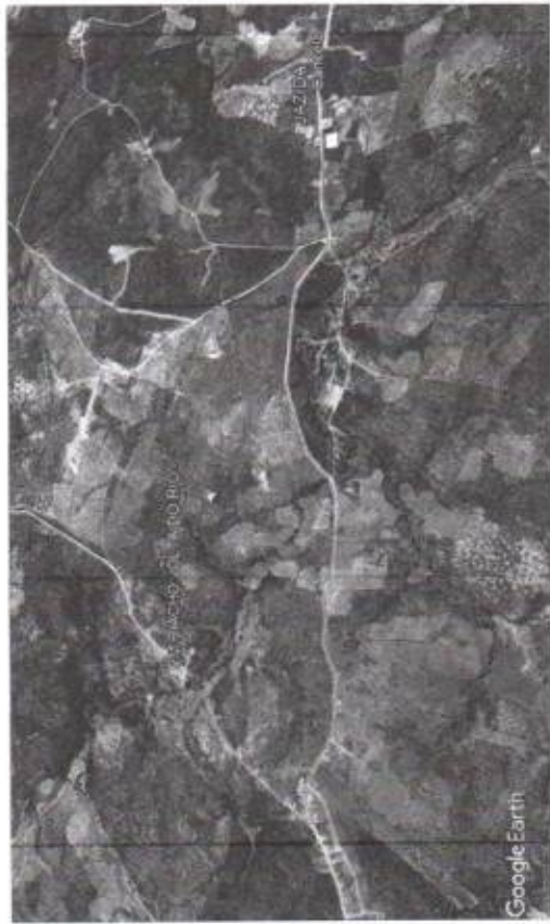
03 LOCALIZAÇÃO PASSAGEM ATÉ A ÁGUA

OBSERVAÇÕES: DISTÂNCIA DA SEDE A LOCALIDADE = 1,00Km COMPRIMENTO PASSAGEM MOLHADA = 50,00m